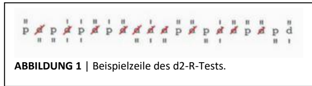
ABBILDUNG 1 | Beispielzeile des d2-R-Tests.

je 57 Zeichen. Die Zeichen sind die Buchstaben "d" und "p". Sie werden von verschiedenen Markierungen umgeben, die aus ein